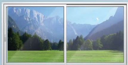
PremiDoor 88 avec ouvrant levant coulissant et cadre fixe